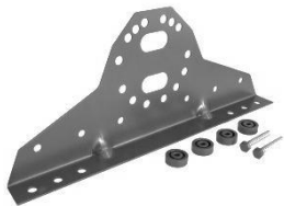
Комплект кронштейн снегозадержателя

Труба плоскоовальная 3 м – 2 шт Кронштейн универсальный Grand Line – 4 шт Саморез 8x60 мм – 8 шт ЭПДМ уплотнитель – 16 шт